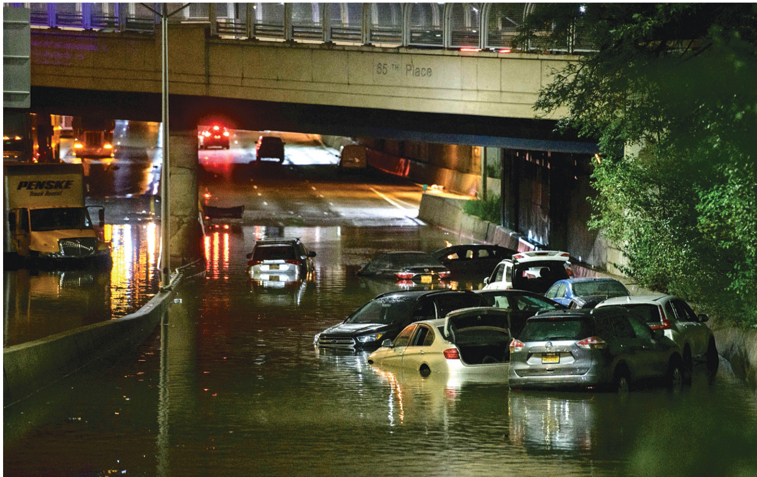
ED JONES / AFP

●● Estamos enfrentando um evento climático histórico com chuvas recordes em toda a cidade, inundações brutais e condições perigosas em nossas ruas