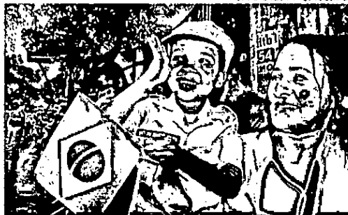
Público acompanha o desfile do ano passado, em Salvador

CONFIRA AS BARREIRAS E ALTERNATIVAS NO TRÂNSITO EM CORREIO24HORAS.COM.BR